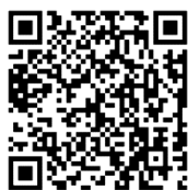
宜花 DOC FB 粉絲專頁